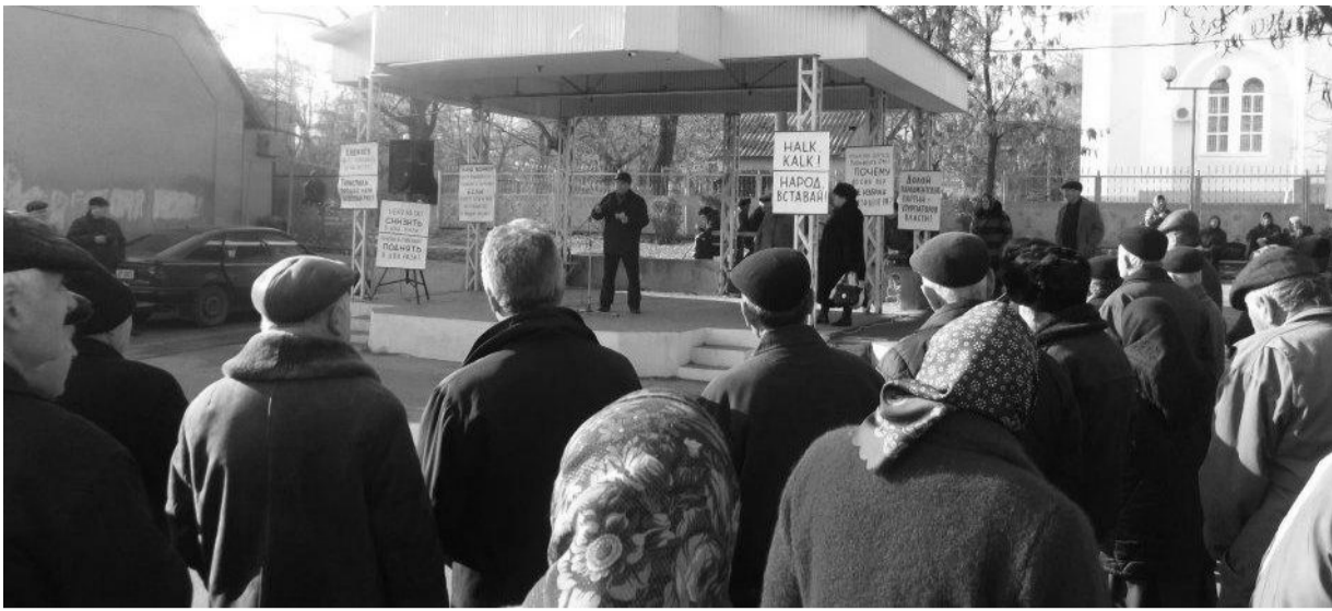
4 декабря - новый митинг в Комрате