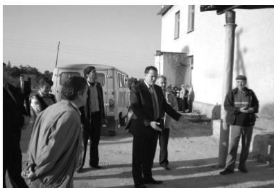
Собственность (движимое и недвижимое имущество).