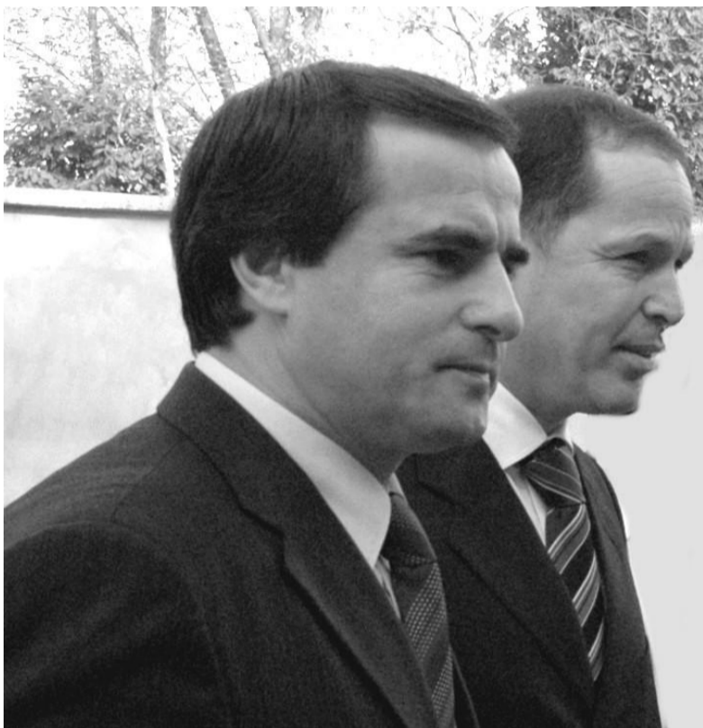
На фото: Василий ТАРЛЕВ в Комрате на предприятии «Vita-Pharm», 2007 год

Молдове нужна новая внешняя политика – мудрая, рациональная, предсказуемая, исходящая из национальных интересов страны и политического прагматизма, а не из личных амбиций определенных политиков. Периоду метаний и явно затянувшейся игре на противоречиях между Великими державами должен быть положен конец.