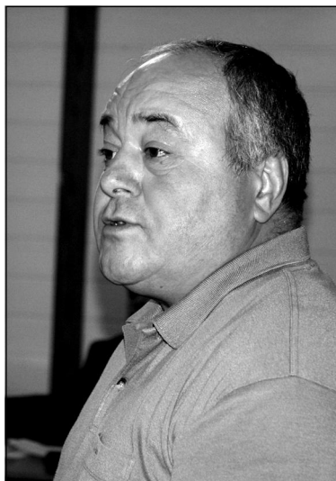
Депутат Илья Чолак.