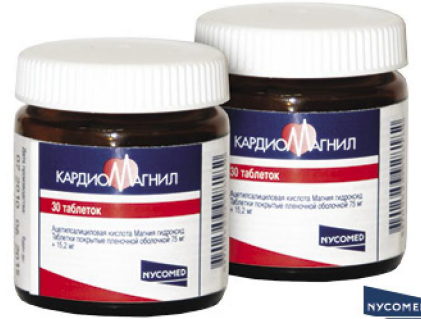
Регистрационный номер № 11700 от 26.06.07. Препарат отпускается без рецепта. Внимательно ознакомьтесь с инструкцией. В случае возникновения побочных эффектов обращайтесь к врачу или фармацевту. www.nicomed.ro

7.45 "Их нравы". 8.25 "Едим дома". 9.20 "Первая передача". 9.55 "Развод по-русски". 11.00 "Дачный ответ". 12.20 "Адвокат". 14.05 "Своя игра". 15.20 "Следствие вели...". 16.20 "И снова здравствуйте!". 17.20 "ЧП". Обзор. 19.00 "Чистосердечное признание". 19.50 "Центральное телевидение". 21.00 "Тайный шоу-бизнес: Л. Зюкина: сокровища королевы". 21.55 "НТВшники". 23.05 "Назад в будущее-2". 01.20 Футбольная ночь.