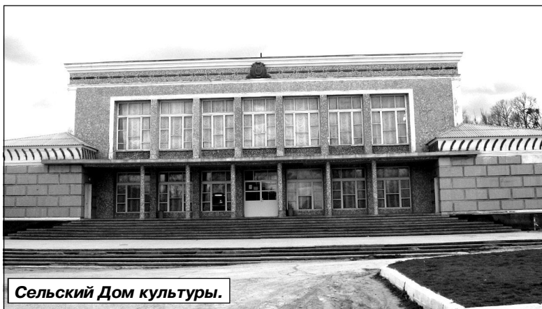
Сельский Дом культуры.

Развитию стратегической программы способствовали основы, заложенные большей частью в 2010-м году. В этот период была улучшена материально-техническая база всех учебных заведений, закуплено оборудование для школ и садиков, проведена частичная их компьютеризация. Появились новые заборы вокруг учебных заведений и дсадов. Жители оценили удобства от освещения ночных улиц центральной части села. Для того, чтобы