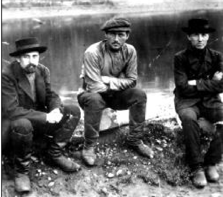
Один из участников восстания Д.И. Маджар (слева) в Иркутской области (в ссылке).