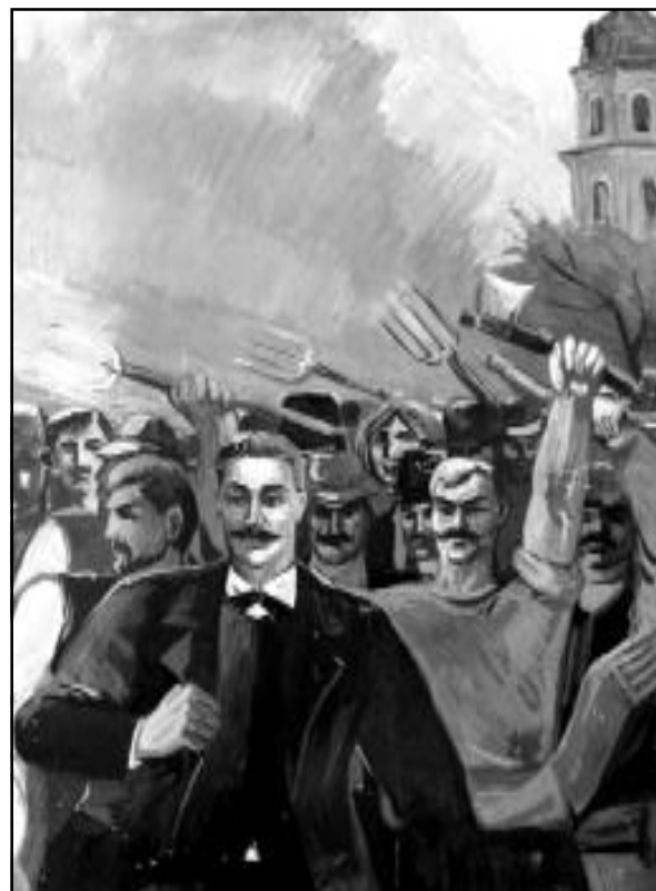
Картины художников Широкограда и Савастина, посвященные Комратскому крестьянскому восстанию 1906 года.