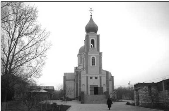
Беизгиоз – церковь.