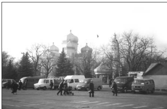
Комрат – собор.