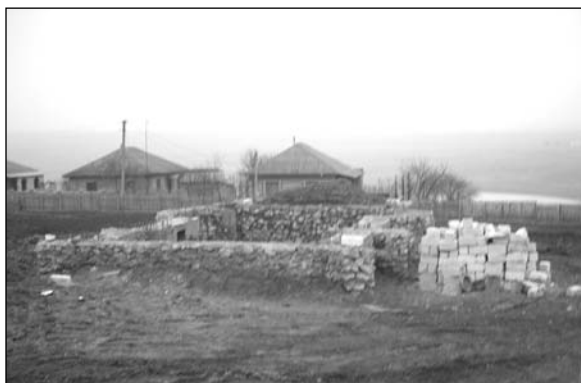
Буджак – строительство новой церкви.