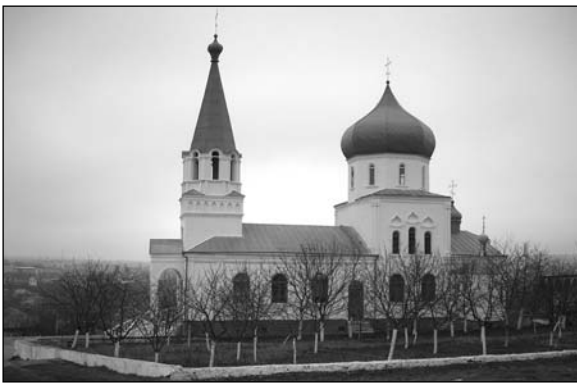
Чадыр-Лунга – церковь.