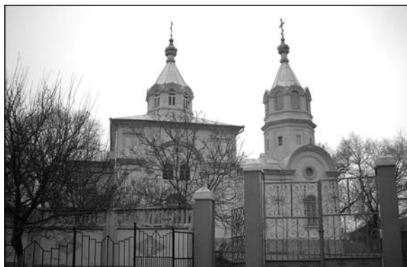
Гайдары – църковъ.