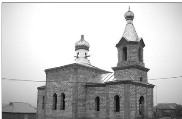
Верхний Конгазчик – строительство новой церкви.