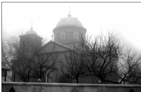
Чок-Майдан – църковъ.