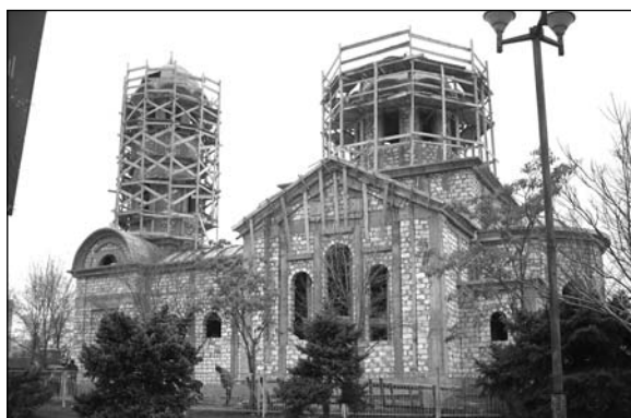
Чадър-Лунга – строительство новой церкви (2008 г.).