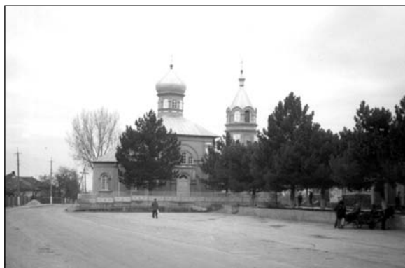
Бешалма – църковъ.