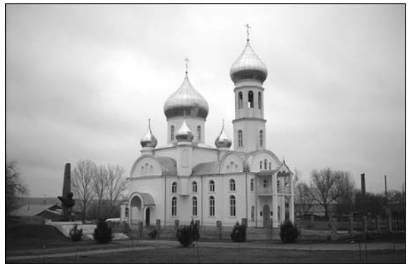
Светлый (Светлое) – церковь.