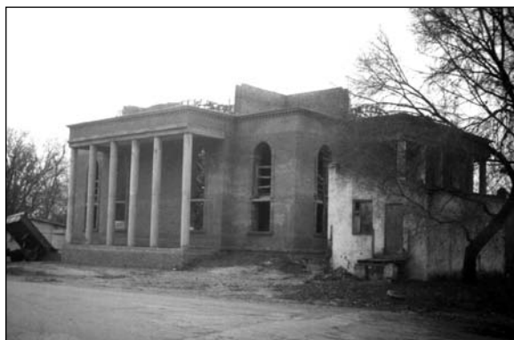
Вулканешты – строительство новой церкви (2006 г.).