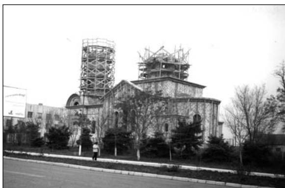
Чадър-Лунга – строительство новой церкви (2006 г.).