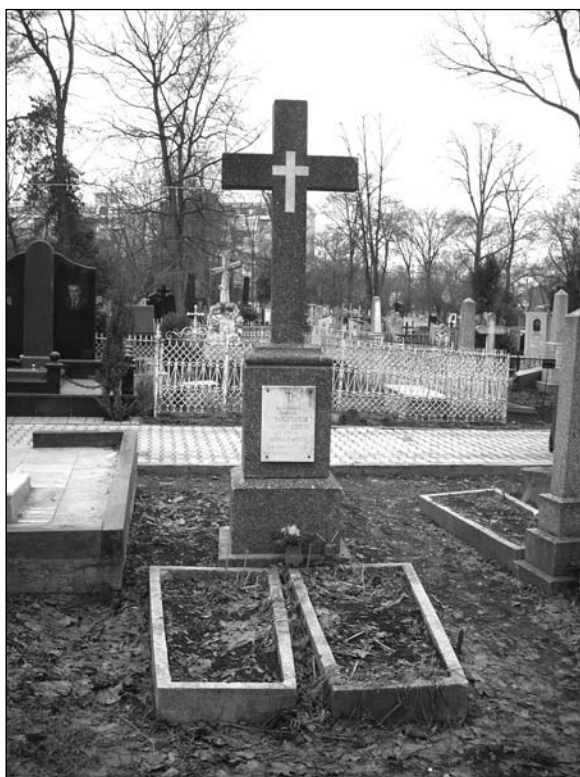
Кишинев, могила Михаила Чакира.

зрения, период пребывания Буджака в Советском Союзе был очень тяжёлый и, зачастую, трагический.