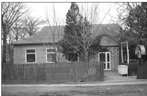
Котовское – молельный дом.