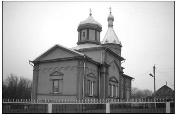
Дезгинжа – церковь.