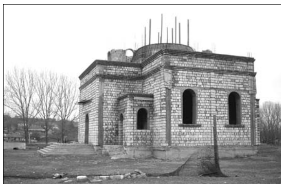
Чишмикиой – строительство новой церкви.