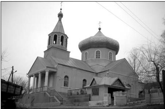
Етулия – церковь.