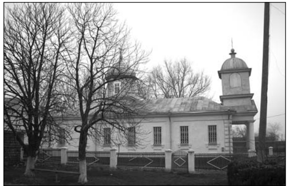
Ферапонтьевка – церковь.