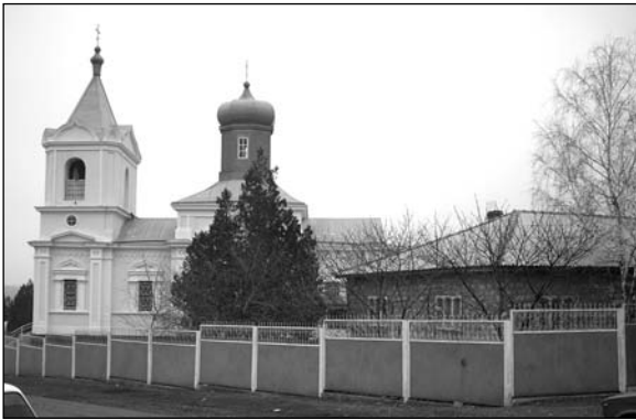
Кириет-Лунга – церковь.