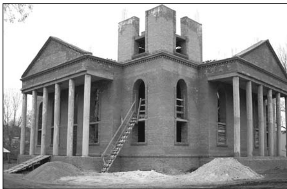
Вулканешты – строительство новой церкви (2008 г.).