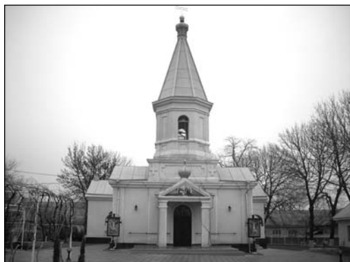
Томай – църковъ.