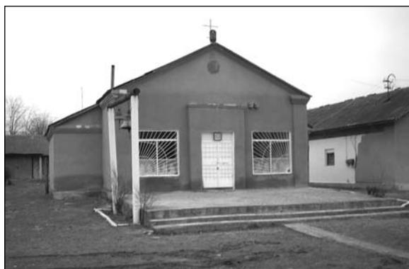
Чиимикией – молельный дом.