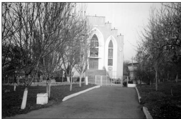
Вулканешты – дом баптистов.