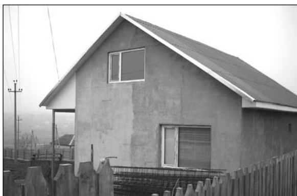
Буджак – молельный дом.