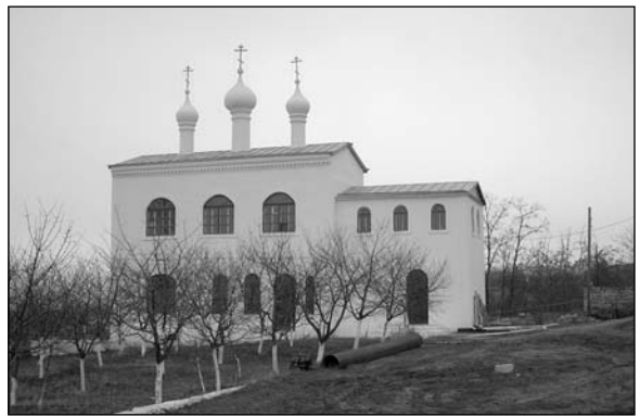
Чадыр-Лунга – Свято-Дмитриевский монастырь.