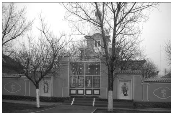
Авдарма – църковъ.