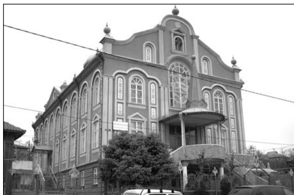
Чадър-Лунга – протестанская церковь.