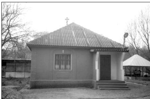
Вулканешты – молельный дом.