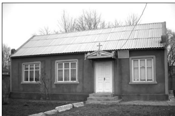
Верхний Конгазчик – молельный дом.