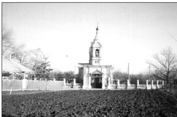
Кирсово – църковъ.