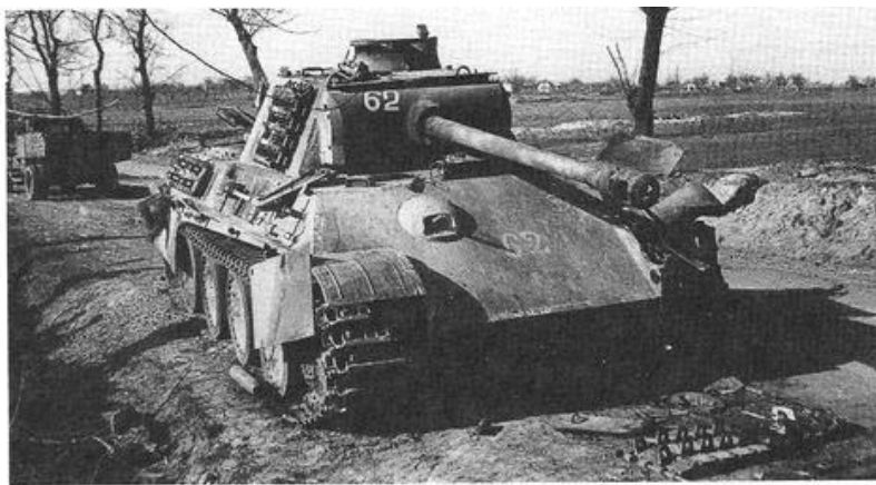
Подбитый немецкий танк Pz. V Ausf. G. Район озера Балатон, март 1945 года. На лобовом листе корпуса видно обозначение 23-й танковой дивизии вермахта и советский трофейный номер 62. Машина имеет орудийную маску позднего типа, с так называемой «бородой» (АСКМ).

Главную роль в отражении их ударов сыграли противотанковая артиллерия, огонь танков и САУ из засад, действия штурмовой авиации и широкий маневр на угрожаемые направления дополнительных сил и средств. За два дня советские войска уничтожили до 4 тыс. немецких солдат и