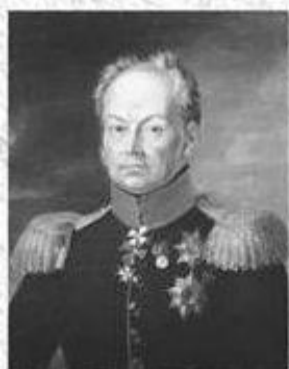
Иван Никитич Инзов