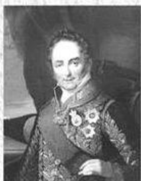
Виктор Павлович Кочубей