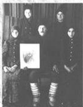
Семейство бессарабских болгар

Национальная научная конференция с международным участием «Болгары и гагаузы Буджака: события и судьбы» состоится 11 марта 2020 г. в 11.00 часов в городе Твардица.