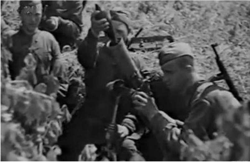
Как начались оборонительные операции в Молдове в 1941 году, рассказал директор комратского краеведческого музея.

Ранним утром 22 июня 1941 года Третий рейх атаковал СССР, начались бои на западных границах Советского Союза. Красная армия приступила к оборонительным операциям в Молдове.