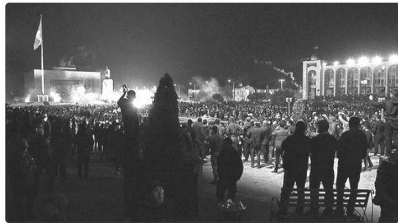
Беспорядки в Бишкеке