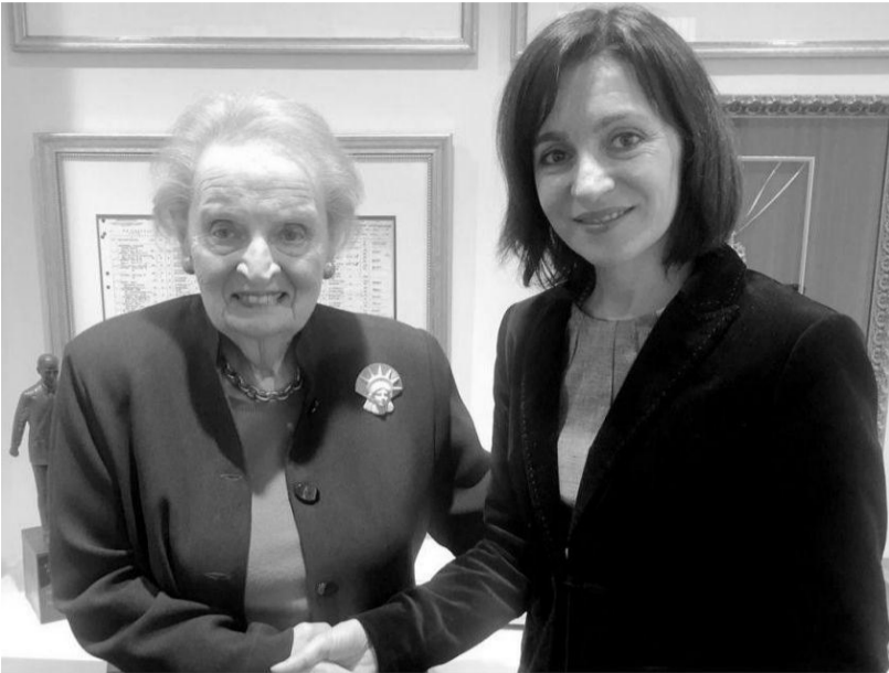
Maia Sandu alături de Madeleine Albright, Secretar de Stat al SUA (1997-2001)