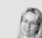
ВИЦЕ-ПРЕДСЕДАТЕЛЬ PAS ЮЛИАНА КАНТАРАЖИУ

проходил стажировки в 2001, 2002, 2005 годах в Будапештском центрально-европейском университете, учредителем которого является Дж. Сорос.