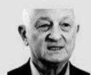
ЧЛЕН НАЦИОНАЛЬНОГО БЮРО PAS О. НАНТОЙ

Экс-министр юстиции, экс-директор НПО AGER. В 2007 - 2010 гг. работала в Фонде Сороса директором программ