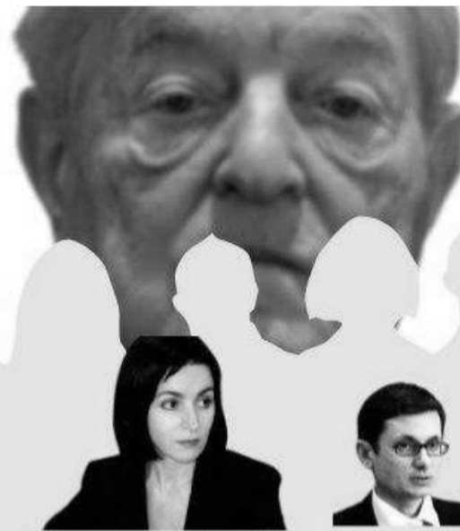
МАЙЯ САНДУ БЫВШИЙ ЧЛЕН СЕНАТА «СОРОС-МОЛДОВА» (2009–2010 ГГ.)