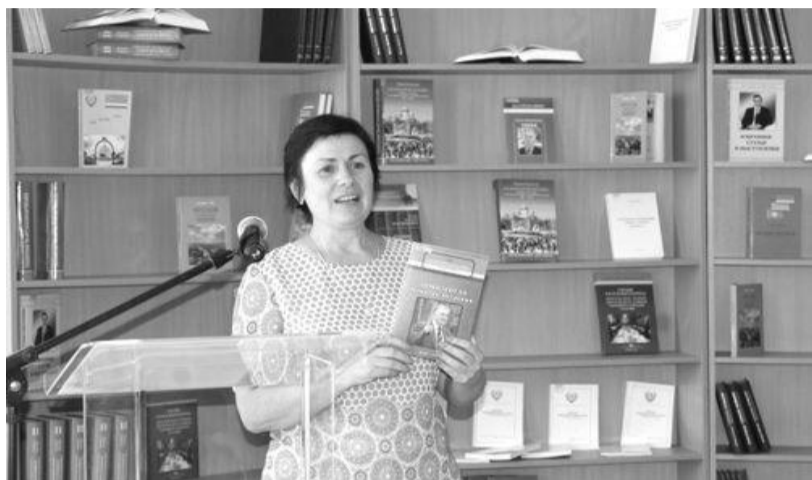
Презентация печатных изданий, посвященных образованию Гагаузской Республики, прошла в Комрате в понедельник, 17 августа.