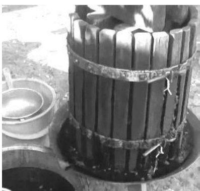
«У меня 0,16 га виноградников, которые я обрабатываю, начиная