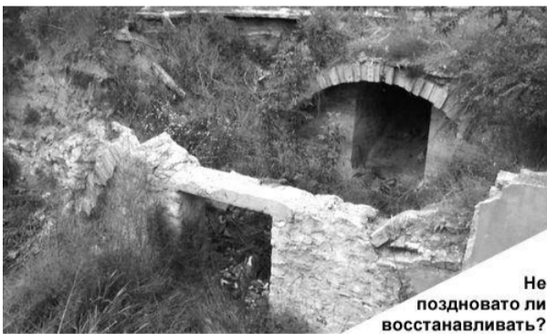
Не поздно ли восстанавливать?

Власти муниципия Комрат начали разработку туристического проекта, объектом которого могут стать подземные катакомбы