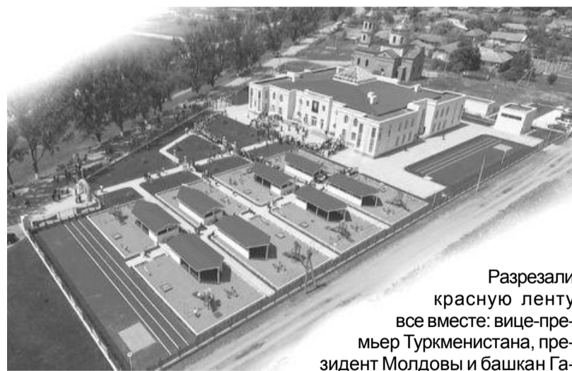
Разрезали красную ленту все вместе: вице-премьер Туркменистана, президент Молдовы и башкан Гагаузии.

В селе Чешмя Вулканештского района 16 мая официально открыли детский сад «Достлук», построенный всего за полтора года под патронажем президента Туркменистана Гурбангулы Бердымухамедова.