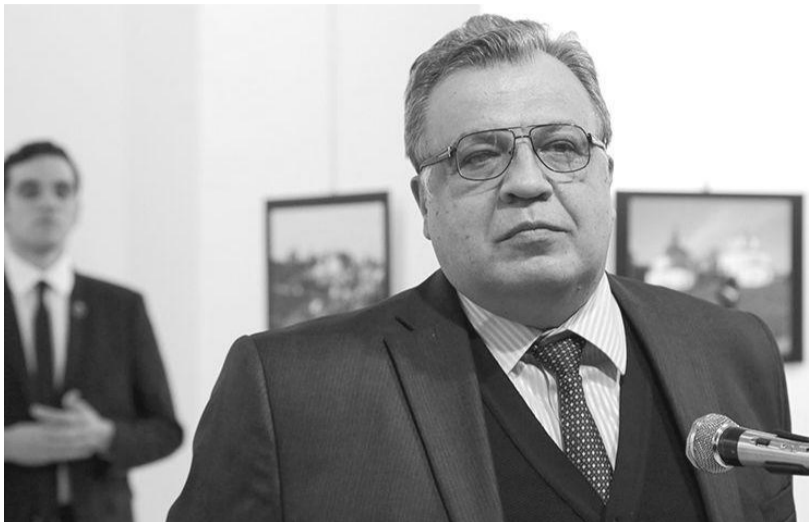
На фото: убийца стоит за спиной посла и ждет момента

В Анкаре совершено нападение на посла Российской Федерации Андрея Карлова.