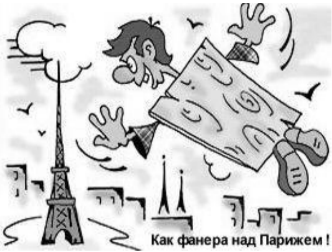
Как фанера над Парижем!

вают различные проекты по развитию социальной сферы или инфраструктуры, а региональные офисы, через которые ведётся финансирование, определяют приоритетность тех или иных проектов и выносят соответствующее решение.