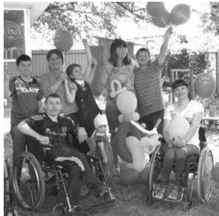
Они не принесут доход. Они просто ждут помощи!

От себя мы еще полагаем, что в этом Центре должна быть заложена функциональная возможность отдавать туда инвалида на несколько дней, если его опекунам надо куда-то уехать в командировку и не на кого подопечного оставить. Знаем не понаслышке примеры таких ситуаций — в Комрате даже за деньги такую услугу сегодня получить НЕГДЕ.