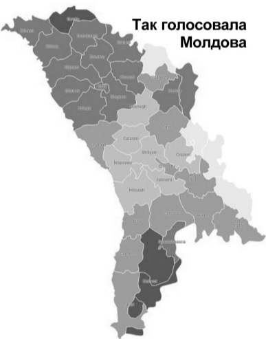
Так голосовала Молдова