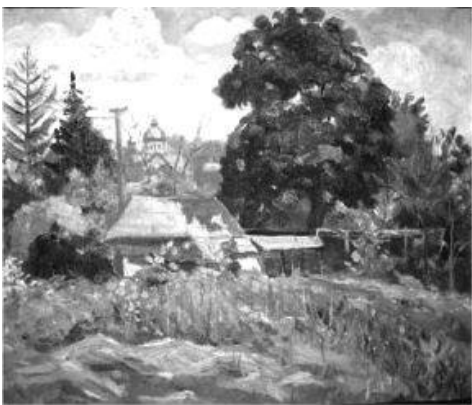
AUSSTELLUNGEN Gagauzische Kunst

узских художников, опубликованном на официальном сайте города Веймар: