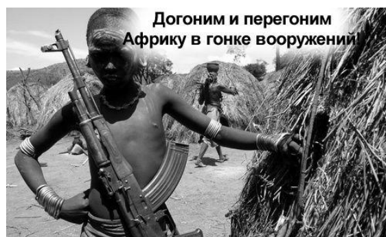
Догоним и перегоним Африку в гонке вооружений

В первом trimestre 2016 года Республика Молдова ввезла из Болгарии и Словакии, транзитом через Румынию, оружия более чем на 1 миллион евро.