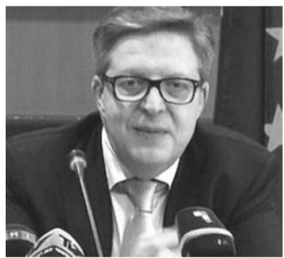
Глава Делегации ЕС в Молдове