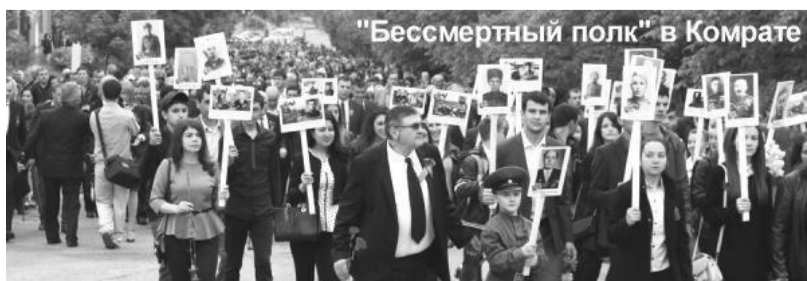
«Бессмертный полк» в Комрате

Не исключено, что Комрат стал единственным городом Молдовы, где в эти часы гремел привычный салют.