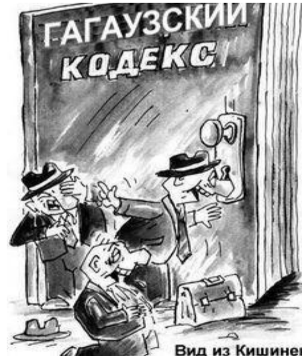
Вид из Кишинева