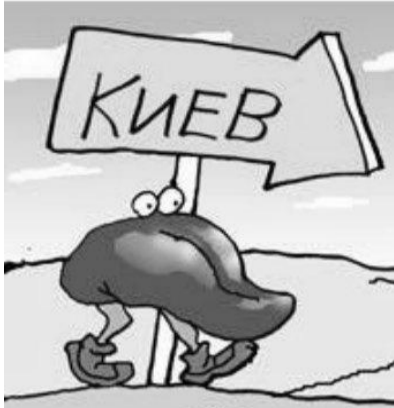
Фразу "Язык до Киева доведет" с недавних пор в Молдове стали понимать иначе

Что мы, например, найдем в Интернете на гагаузском языке? В