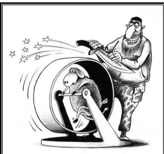
Совместная жизнь и сотрудничество больших и малых народов

Становится экономически целесообразным, политически выгодным, а потом и просто модным переходить в общении на язык севшего на шею большого народа. Говорить на своем родном - это уже «признак