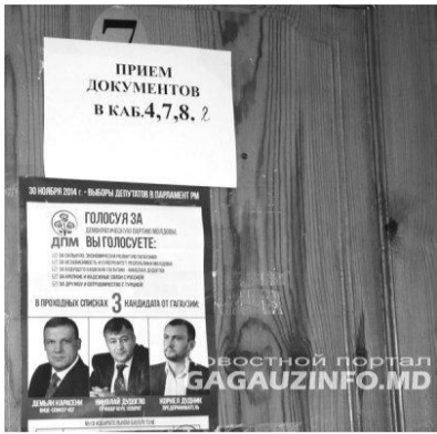
Отдел учета и документирования граждан муниципалитета Комрат обклеен листовками Демократической партии.

мокротической партии. Агитационные плакаты наклеены как вблизи, так и на самом здании государственного учреждения.