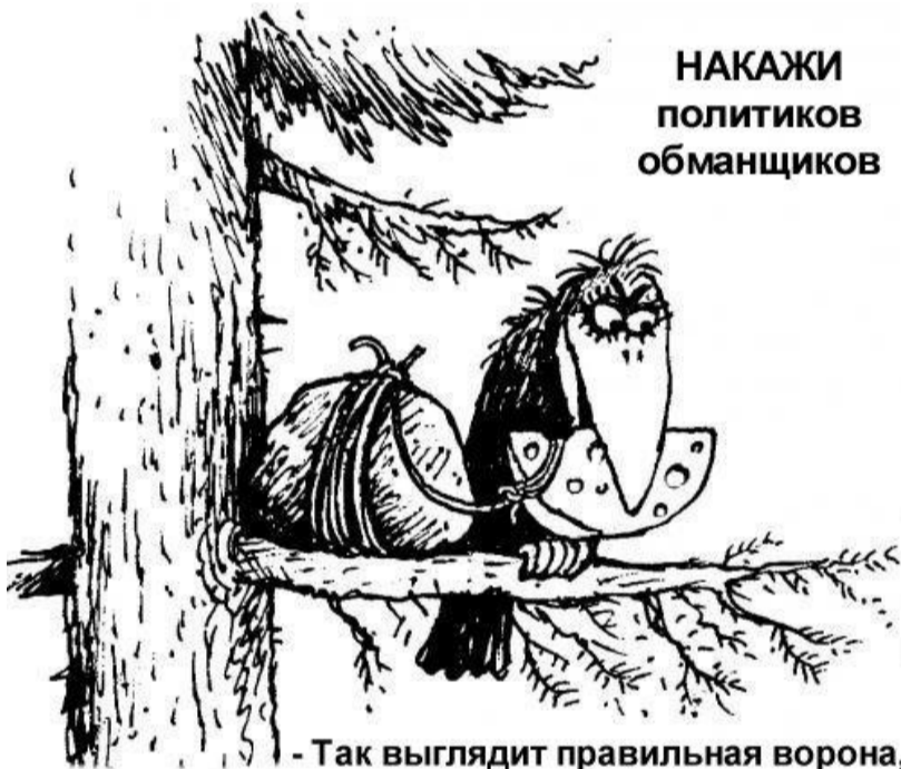
Так выглядит правильная ворона, которую замасливают предвыборными речами, чтобы отнять последний сыр

Более того, «благодаря» политике нынешних властей, несмотря на снижение цен на газ для Молдовы, цены для населения могут... повыситься!