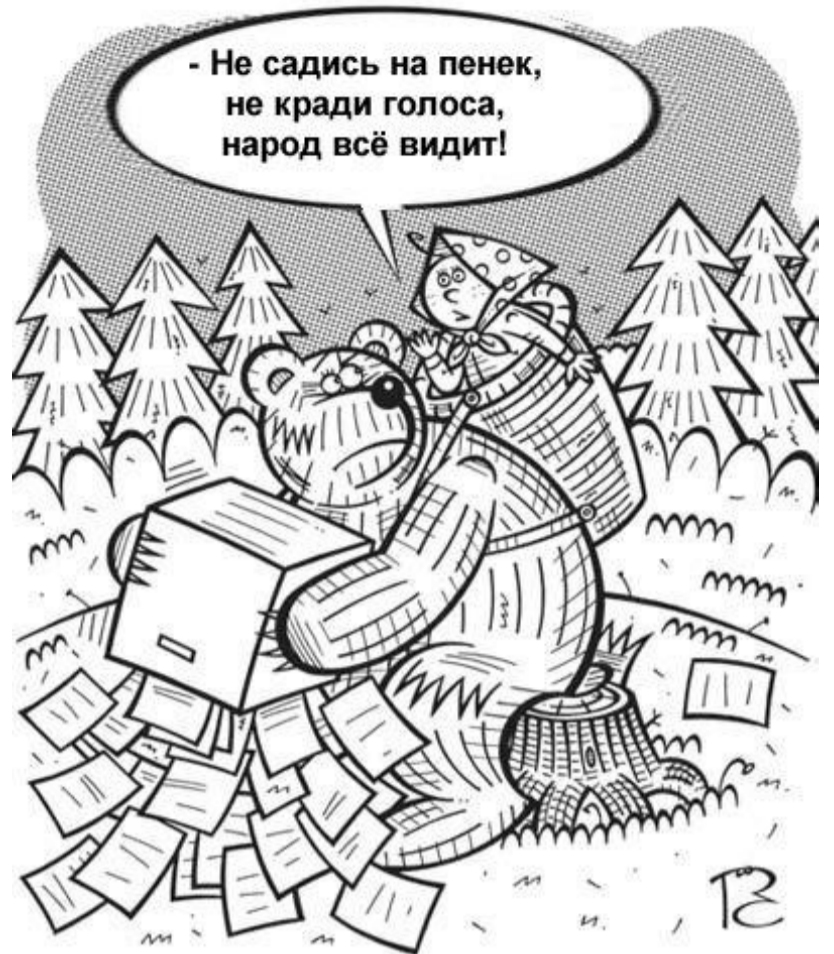
Избиратель, будь бдителен, в этот раз отпечатали столько бюллетеней, что есть откуда и что украсть!

«Населению придется платить больше из-за спекуляций, организованных на валютном рынке находящимися у власти олигархами», - заключает он.