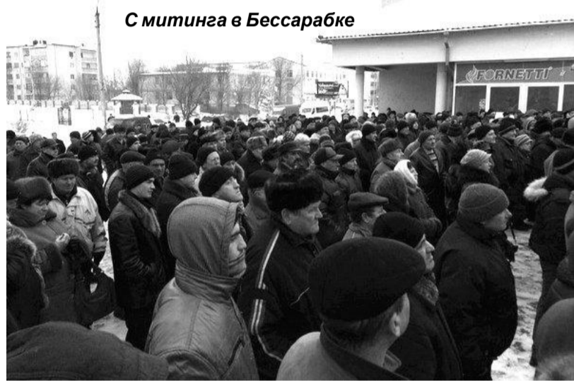
С митинга в Бессарабке