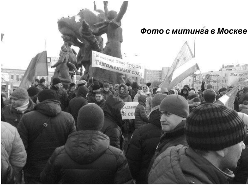
Фото с митинга в Москве

«Остановили автобусы, заставили людей выйти возле железнодорожного вокзала. Пришлось идти оттуда (до места собрания - ред.) около трех километров пешком, по морозу. Но все же сход состоялся. Граждане проявили солидарность, пришло около 1500 человек. Считаю, что все предпринятое полицией, чтобы помешать нам, обернулось против самой власти».