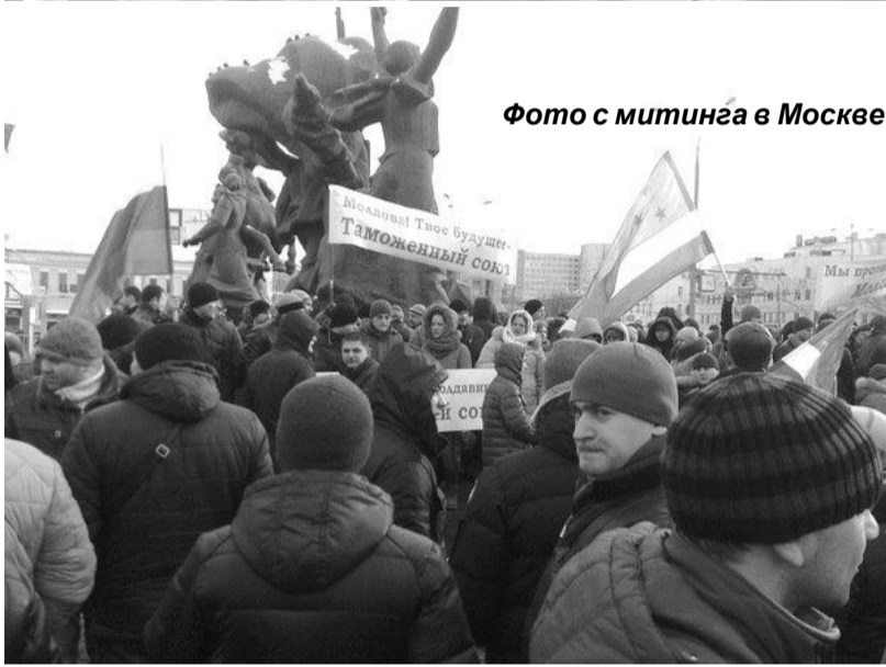
Фото с митинга в Москве

«Остановили автобусы, заставили людей выйти возле железнодорожного вокзала. Пришлось идти оттуда (до места собрания - ред.) около трех километров пешком, по морозу. Но все же сход состоялся. Граждане проявили солидарность, пришло около 1500 человек. Считаю, что все предпринятое полицией, чтобы помешать нам, обернулось против самой власти».