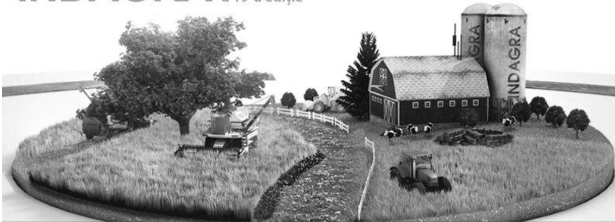
Târgul internațional de produse și echipamente în domeniul agriculturii, horticulturii, viticulturii și zootehniei