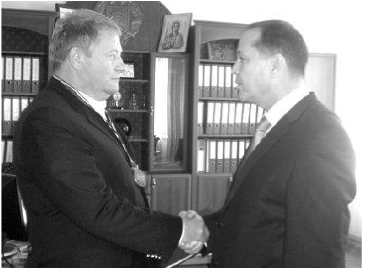
На фото: Юрий Якубов с Башканом Гагаузии М. Формузала