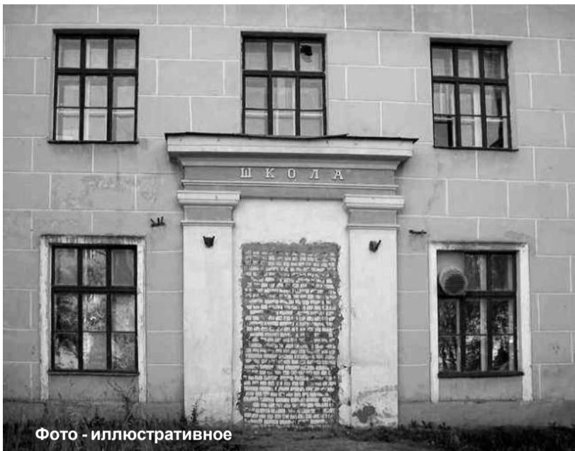
Фото - иллюстративное