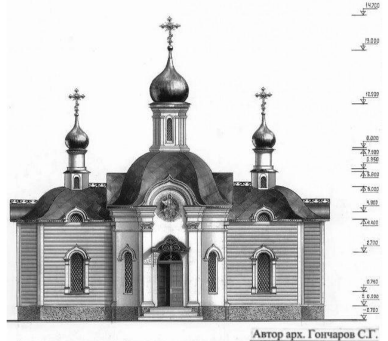
Автор арх. Гончаров С.Г.

В пресс-службе башкана уточнили, что архитектор пробудет в Гагаузии на протяжении двух дней.