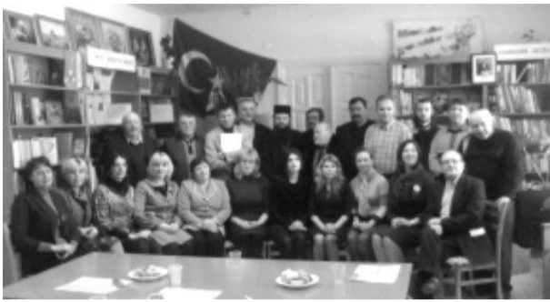
Об этом со ссылкой на организаторов сообщает портал «Haberlar».

Мероприятие было организовано и подготовлено общественной организацией «Мерас».