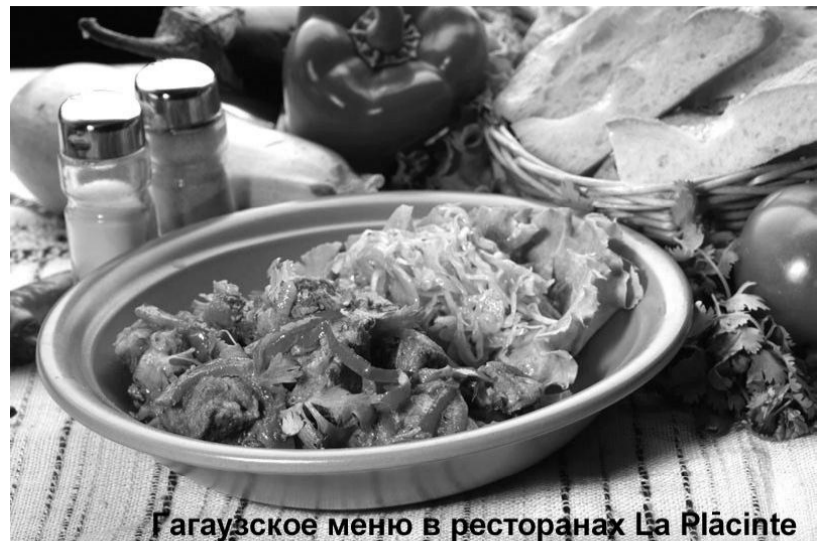
Гагаузское меню в ресторанах La Plăcinte

1 место. И самая грандиозная первоапрельская шутка: Бристольская радиостанция сообщила о том, что построена точная копия «Титаника» и он выходит в море 1 апреля. Также сообщалось о том, что «Титаник» будет хорошо видно с берега, куда и ринулись тысячи апрельских дураков. Пришлось поднимать на ноги береговую охрану.