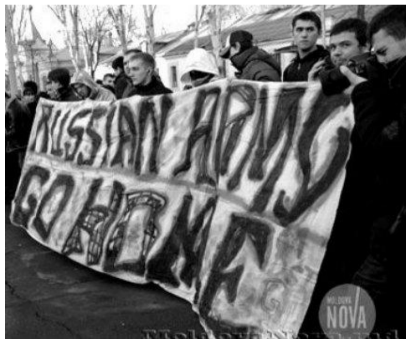
Забавные фото с акции протеста Actiunea-2012 у здания российской дипмиссии в Кишиневе и у здания МИДЕИ (14 января, Кишинев).

Сразу ясно для кого стараются "митингующие", и даже (как знать!) чьи деньги отработывают. Обращение к русским "Возвращаться домой" написано почему-то не на русском языке, что было бы понятно "оккупантам", а на английском и румынском, чтобы было понятно работодателям.