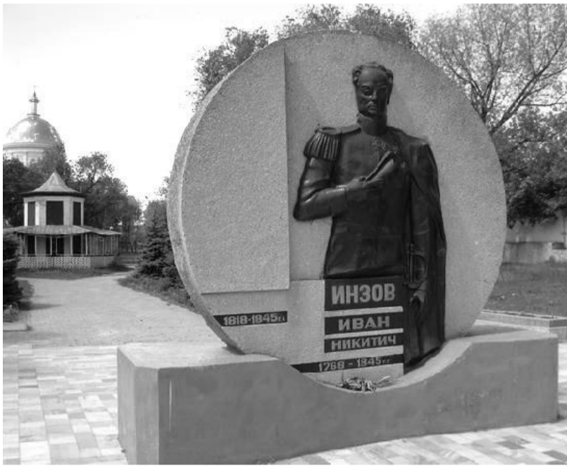
На фото: памятник И. И. Инзову в Болграде

После этого заявления к 1812 г. количество переселившихся в Бессарабию возросло с 4 тыс. в 1809 г. до 25 тыс. Но с отъездом Кутузова из армии в связи с начавшейся войной с Наполеоном управление в крае стало осуществляться по местным законам и обычаям. Переселенцев административно приравнивали к коренному населению и лишали прав на особое положение. При этом ужесточилась откупная система, буджакские земли