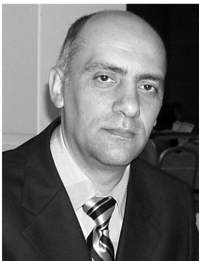
Окончание. (Начало на стр. 2)

«20 октября журналисты стали свидетелями, как председатель Либеральной партии Михай Гимпу и лидер Партии коммунистов Владимир Воронин долгое время прогуливались вместе по холлу Дворца Республики в Кишинёве, где проходят парламентские заседания, - пишет publika.md. - Со стороны это выглядело, как беседа старых друзей, что и вызвало интерес представителей СМИ. На просьбу журналистов прокомментировать дружескую беседу, политики признались, что пришли к соглашению о совместных действиях коммунистов и либералов против ЛДПМ. И первым шагом в запланированных действиях нового политического тандема станет, по словам самих лидеров политформирований, совместное голосование за отставку председателя комиссии по экономике, бюджету и финансам Вячеслава Ионицэ, который представля-