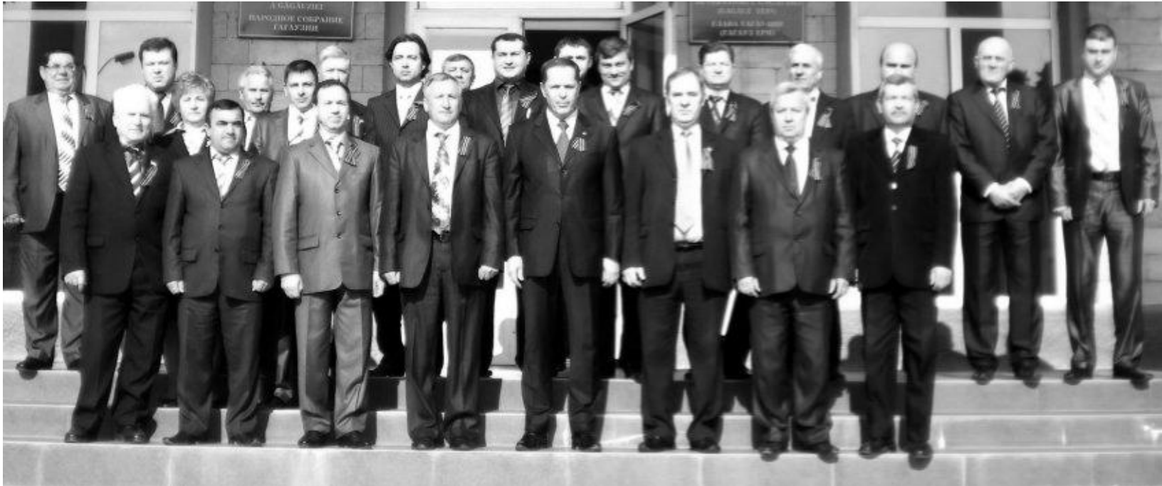
В Гагаузии, по инициативе и непосредственному участию общественного движения «Единая Гагаузия», началась акция по раздаче георгиевских ленточек, поддержанная в Гагаузии на официальном уровне.