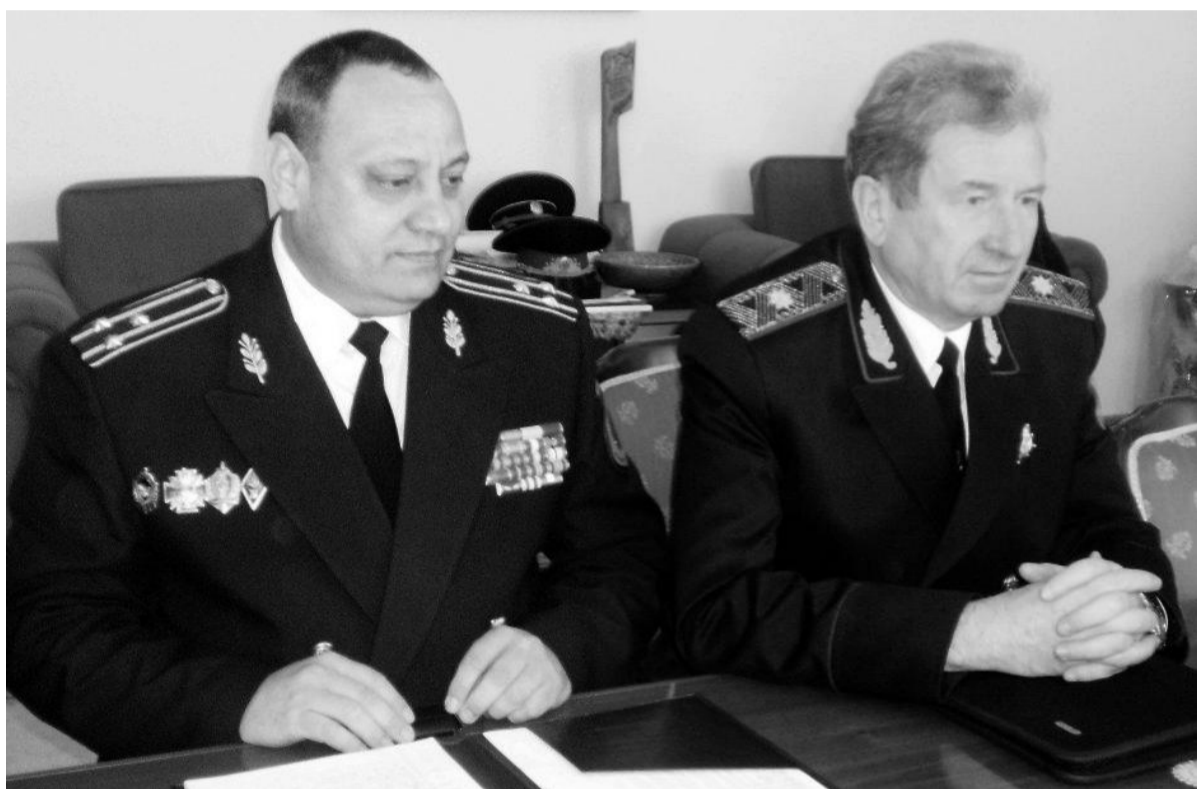
На фото: слева направо - Ю. Кептэнару и Министр МВД Молдовы В. Катан