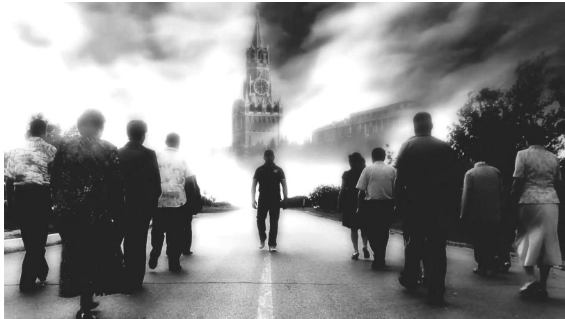
На фото: кадр из клипа «Ватан» Е. Капсамун – разъезжаются наши люди...

Не секрет, что после восьми лет коммунистического правления, Молдова стала самой бедной страной Европы. Логика коммунистов в этот период была проста до примитивизма – пусть страну покинут как можно больше людей, а на деньги, которые они переведут, будут содержать бюджет.