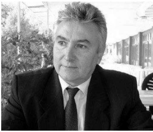
На фото: Губернатор Варненской области Данчо Симеонов

Гагаузия будет надеяться на возможность отправки своих студентов на учебу в Варну, но представила там и презентацию своей гордости в сфере образования – Комратского государственного универ-