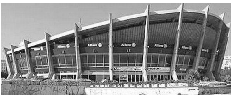
На фото: Свободный Университет Варны