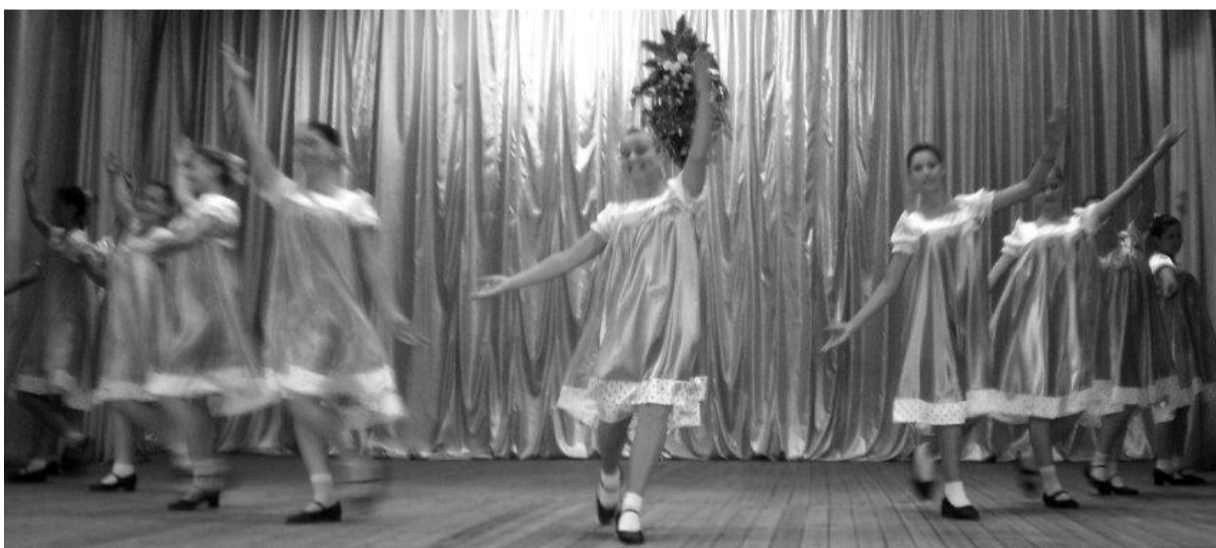
На фото: концерт в Комратском Доме культуры, посвященный Дню независимости Молдовы