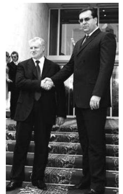
На фото: Давние связи с Россией - М. Лупу и С. Миронов

Окончательно заручившись российской поддержкой, Мариан Лупу может позволить себе более уверенно настаивать на своей точке зрения внутри правящего альянса. Он, в частности, уже заявил, что настаивает на изменении статьи 78