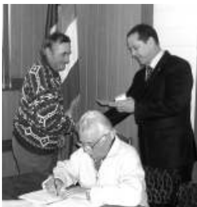
На фото: Вручение удостоверений старейшинам Гагаузии

12 февраля в Комрате состоялось очередное заседание Совета старейшин Гагаузии. Этот консультативный орган работает на добровольной основе и призван укрепить обратную связь высшей исполнительной власти автономии с народом. Уважаемые в своих населенных пунктах пенсионеры, вошедшие в состав Совета, полностью независимы от Башкана и Исполкома Гагаузии, потому что не являются штатными сотрудниками, не получают за свою деятельность оплаты и абсолютно свободны в своих высказываниях. Им не надо стараться угождать власти, потому что они ею не ангажированы, им ничего не надо от власти, при том что за их плечами огромный и весьма ценный жизненный опыт. По мнению Башкана, именно это является наиболее привлекательной частью проекта по созданию Совета старейшин.