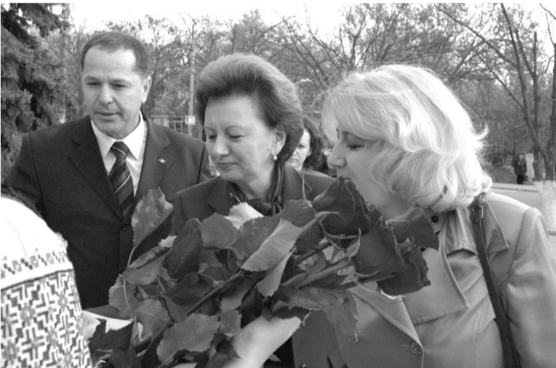
На фото: Встреча Премьер-Министра Молдовы З. Гречаной

ся. Хотя в стоимостном выражении они, подчас, обошлись бы даже дешевле. Напротив, на некоторых праздниках на людях многие не прочь подзаработать: разворачивают свои палатки, продают пиво втридорога, по спе-