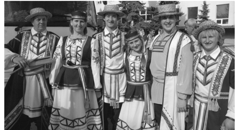
На фото: Ансамбль «Белорусочка» из г. Климовичи