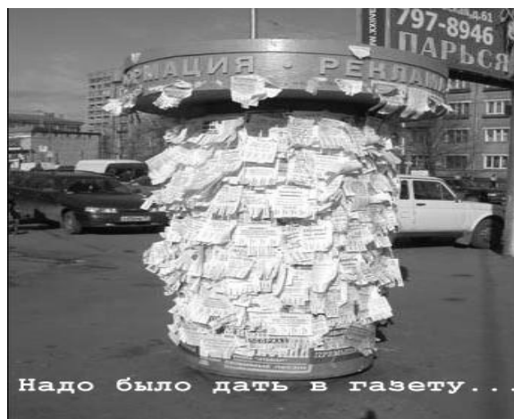
Надо было дать в газету...