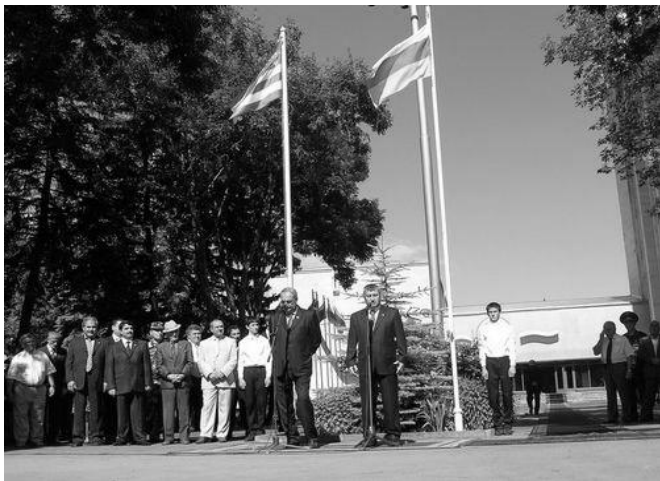
Стоит ли «бить посуду»?

Гагаузские депутаты заявили, что Республика Молдова, однажды уже проявившая мудрость и понимание при разрешении «гагаузского вопроса», доказав тем самым свою приверженность политике уважения права малых народов на самоопределение, сегодня может внести существенный вклад в укрепление мира и стабильности во всём Кавказском регионе. «Особенно важно, что такое решение будет способствовать укреплению и углублению традиционных отношений дружбы и сотрудничества между народами Молдовы и России, послужит надежной основой для расширения взаимодействия наших стран во всех направлениях межгосударственных отношений», - говорится в обращении гагаузского парламента.