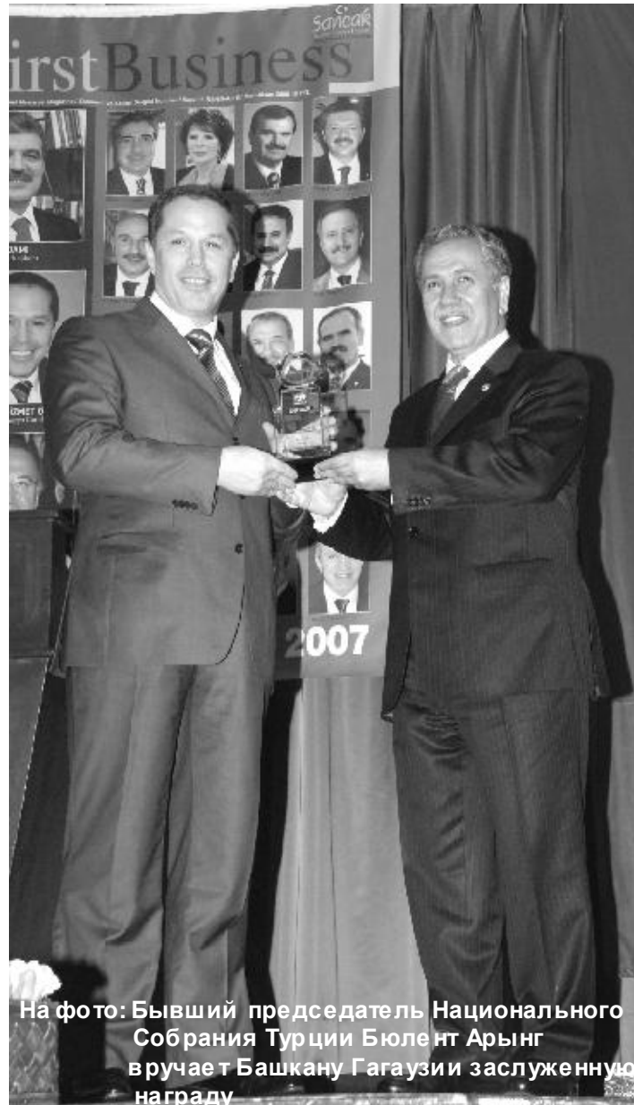
На фото: Бывший председатель Национального Собрания Турции Бюлент Арынч вручает Башкану Гагаузии заслуженную награду

К слову сказать, страны турецкого мира, в первую