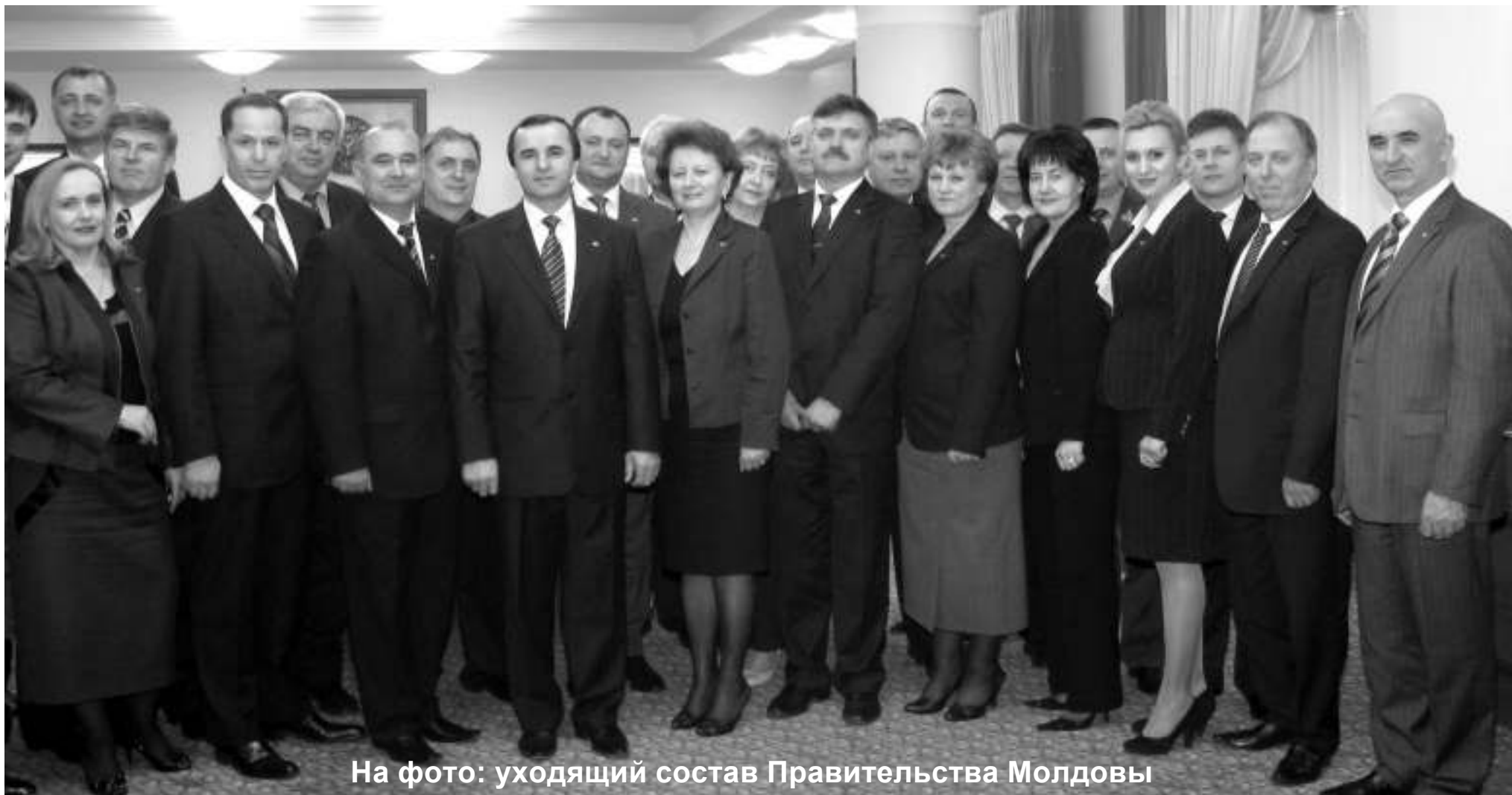
На фото: уходящий состав Правительства Молдовы

19 марта на заседании молдавского Правительства, в котором принимал участие Президент Молдавии Владимир Воронин, Премьер-министр Василий Тарлев объявил о том, что подает в отставку. Тарлев был назначен Премьер-министром Молдавии в 2001 году и занимал пост главы Правительства на протяжении 7 лет. 20 марта в ходе встречи с представителями парламентских фракций президент Молдавии Владимир Воронин предложил на должность Премьер-министра республики кандидатуру первого вице-преьера Зинаиды Гречаной. Согласно Закону о правительстве Молдавии, кандидат на должность премьера в 15-дневный срок после выдвижения просит парламент выразить вотум доверия программе деятельности и всему составу Правительства.