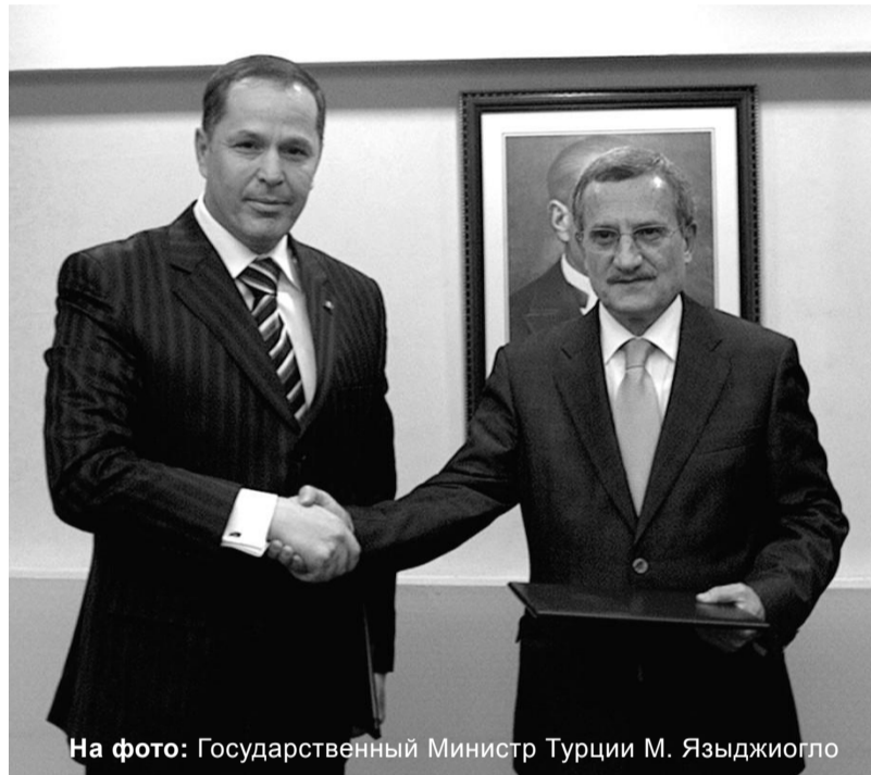
На фото: Государственный Министр Турции М. Языджиоглу

В Министерстве сельского хозяйства высоко оценили такие примеры уже налаженного сотрудничества, как работу в Гагаузии турецких комбайнов в период уборки урожая, закладку в Вулканешском районе плантаций грецкого ореха. Есть предложение увеличить количество задействованных в Гагаузии комбайнов с 8 до 50. При этом целесообразно было бы с помощью турецкого бизнеса открыть на постоянной основе соответствующую машинно-тракторную станцию.