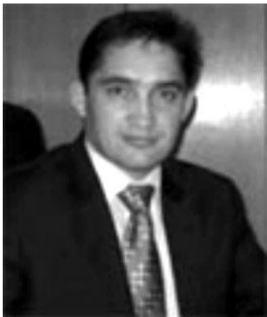
Депутат от Демпартии Александр Стояногло стал новым заместителем председателя парламента РМ.

Он избран на эту должность после того, как высшее законодательное собрание приняло отставку вице-спикера Марчела Рэдукана в связи с назначением того на пост министра строительства и регионального развития.