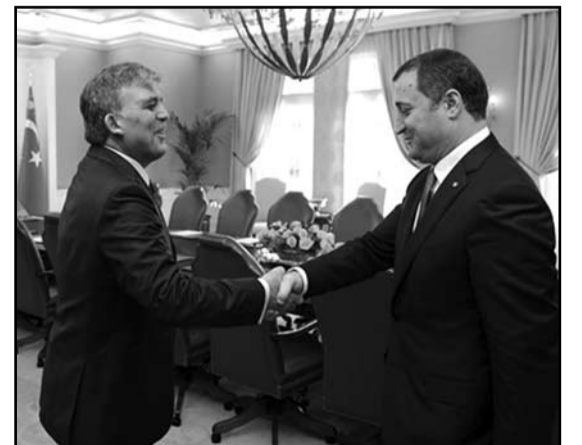
PATRETTÄ: Türkiye Prezidenti Abdullah GÜL hem Moldova premyer-ministrusu Vlad FİLAT.

Not. Yazı gagauzçaya yaklaştırıldı hem ufak kısatmalarla tiparlanêr.